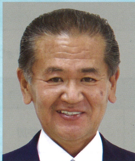
八代港ポートセールス 協議会会長(八代市長)